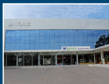
Drugstore Asimed La Torre