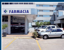
Drugstore Asimed La Costa