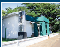
Laboratorio San Roque Villa Morra