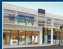
Drugstore La Costa Lynch