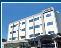
Edificio Corporativo Asimed