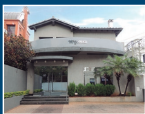
Asimed Oficina Mcal. López