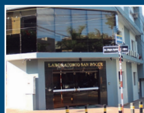
Laboratorio San Roque Centro