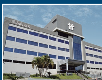
Sanatorio Santa Julia