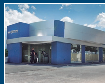
Drugstore Asimed Mcal. López