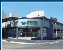
Drugstore Asimed Santa Julia