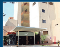
Sanatorio San Roque