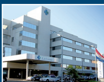
Sanatorio La Costa