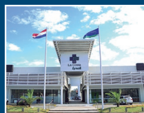
Centro Médico La Costa Lynch