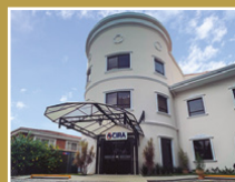
Centro Integral de Rehabilitación (CIRA)