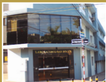
Laboratorio San Roque Centro