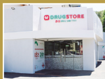
Drugstore Asimed Mcal. López