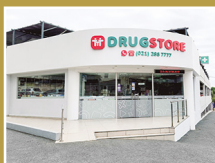
Drugstore Asimed Santa Julia