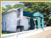
Laboratorio San Roque Villa Morra