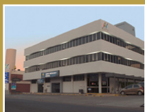
Centro Oncológico Revita