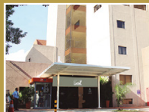
Sanatorio San Roque