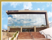
Hospital Universitario San Lorenzo