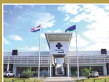
Centro Médico La Costa Lynch