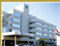
Centro Médico y Sanatorio La Costa