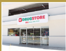
Drugstore Asimed Bahía Parking