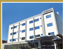
Edificio Corporativo Asimed