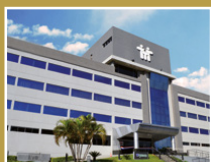
Centro Médico y Sanatorio Santa Julia