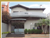
Asimed Oficina Mcal. López