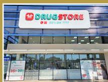
Drugstore La Costa Lynch