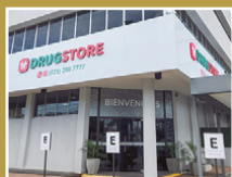
Drugstore Asimed La Costa Artigas