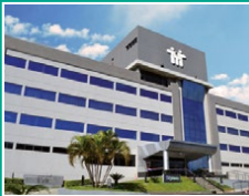
Centro Médico y Sanatorio Santa Julia