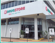
Drugstore Asimed La Costa Artigas