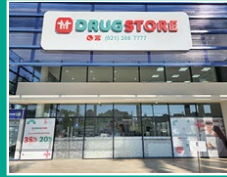
Drugstore La Costa Lynch