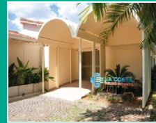
La Costa Neuroinfantil