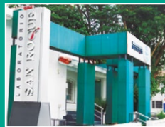
Laboratorio San Roque Villa Morra