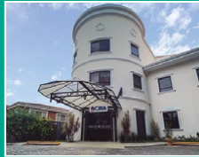
Centro Integral de Rehabilitación Asunción (CIRA)