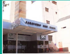
Sanatorio San Roque