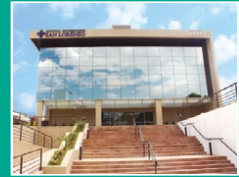
Hospital Universitario San Lorenzo