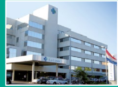
Centro Médico y Sanatorio La Costa