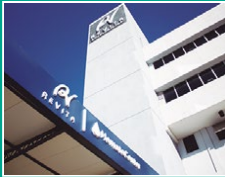
Centro Oncológico Revita