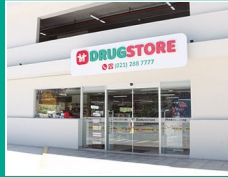
Drugstore Asimed Bahía Parking