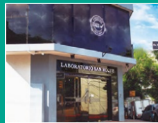
Laboratorio San Roque Centro