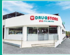
Drugstore Asimed Santa Julia