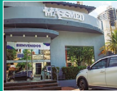
Asimed Oficina Mcal. López