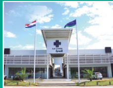
Centro Médico La Costa Lynch