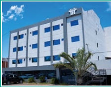
Edificio Corporativo Asimed